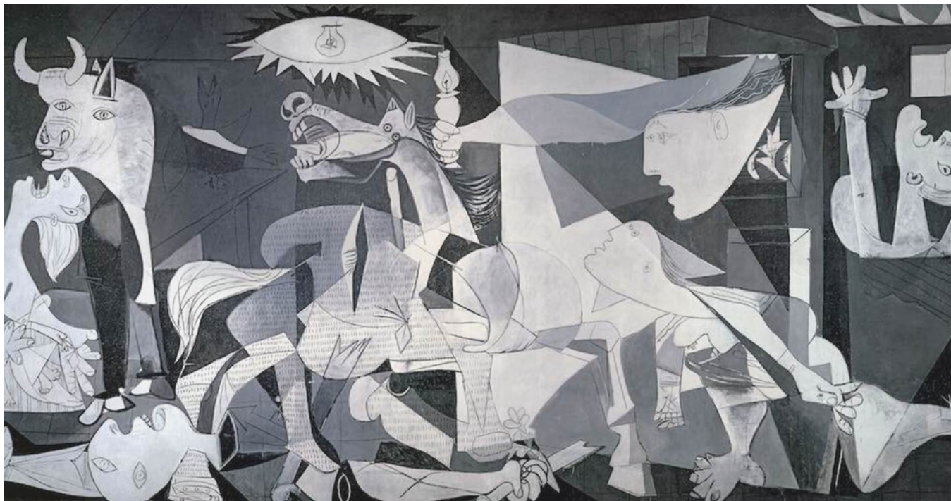
GUERNICA - PABLO PICASSO (1937)